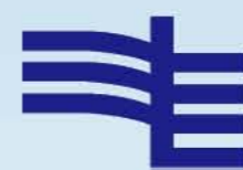
南方电网集团公司