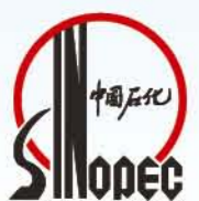
中国石油化工总公司