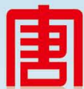
中国大唐集团公司